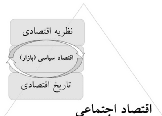
شکل ۳: اقتصاد اجتماعی هایک منبع: یافته‌های پژوهش