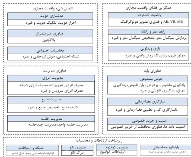
شکل ۱. فناوری‌های مختلف به کار رفته در متاورس (Ning et al. 2021, p.13)

برای متاورس به شمار می‌رود، اما منابعی دیگر همچون فیلم‌های چندگانه‌ی «ماتریکس» (The Matrix) نیز منابع الهام‌بخش و ریشه‌هایی برای متاورس انگاشته شده‌اند (Ibid). تا کنون که قریب به سه دهه از طرح ایده‌ی اولیه‌ی متاورس می‌گذرد، ابهامات و پرسش‌های جدی درباره‌ی امکان‌پذیری و چگونگی آن وجود دارد. اما برای عملیاتی کردن این چارچوب مفهومی و تبدیل این ایده‌ی تخیلی به محصولی فناورانه، زمزمه‌هایی توسط فناوران مطرح عرصه‌ی فضای مجازی مطرح شده است. در بحبوحه‌ی دوران پس از همه‌گیری جهانی کووید-۱۹ (Covid-19) و نیز در میانه‌ی هجده‌های فراوان سیاستگذاران و گروه‌های مختلف اجتماعی به مارک زاکبرگ (Mark Zuckerberg)، مالک فیس‌بوک (Facebook) و سکوه‌های رسانه‌های اجتماعی نظیر اینستاگرام (Instagram)، وی با تغییر نام شرکت خود به «متا» (Meta) توجه اذهان عموم و خصوص جوامع را به خود جلب کرد (Facebook 2021). زاکبرگ با این تغییر نام، از چشم‌انداز مطلوب و حرفه‌ای خود مبنی بر ایجاد یک متاورس رونمایی کرد. اما چه رخدادها و وقایع فناورانه‌ای به او جسارت چنین رونمایی و افشاگری‌ای را داده است؟ می‌توان تصریح نمود آنچه که جسارت بحث از متاورس را به فناوران فضای مجازی داده است، توسعه‌ی فناوری‌ها و نوآوری‌هایی است که در صورت همگرایی و انسجام، متاورس را شکل خواهند داد. برای متاورس، اقسام گوناگونی از فناوری پیش‌بینی شده که در شکل زیر ذکر گردیده‌اند: