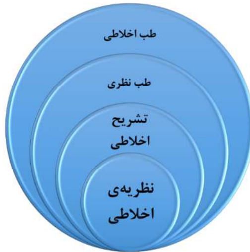
تصویر شماره‌ی (۱): ترتیب توالی، از نظریه‌ی اخلاطی تا طب اخلاطی

(۱)، ترتیب توالی چینش این نظم، از نظریه‌ی اخلاطی تا کل ماهیت طب اخلاطی را نشان می‌دهد.