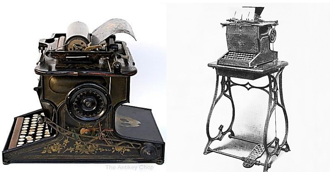
شکل ۱- ماشین تحریر به شکل طرح‌های سنتی قدیمی مثل چرخ خیاطی (Herkimer, ۱۹۲۳)

جدید بنام مدل رمینگتون ۱، ماشین خود را روی یک طرح سنتی پیاده‌سازی کرد (شکل ۱). او ماشین تحریر را روی میز چرخ خیاطی قرار داد و حتی آن را با لاک‌های رنگی و گل‌های زینتی مشابه طرح‌های روی چرخ‌های خیاطی تزیین کرد. این یک ماشین مکانیکی بود که برای به حرکت درآوردن کاغذ، می‌بایست پدالی که در زیر دستگاه تعبیه شده، فشار داده شود تا حرکت کاغذ کنترل گردد (Herkimer, ۱۹۲۳: ۶۳)