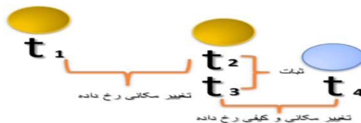
رسم توضیحی ۱: تغییر اتمی در لحظات مختلف

ها خلق شود، ناظر هیچ تغییری را دریافت نمی‌کند. واگر در t_1 ؛ علاوه بر مکان متفاوت با ویژگی‌های کیفی دیگری خلق شود، ناظر علاوه بر تغییر مکانی، تغییر کیفی را نیز دریافت می‌کند.